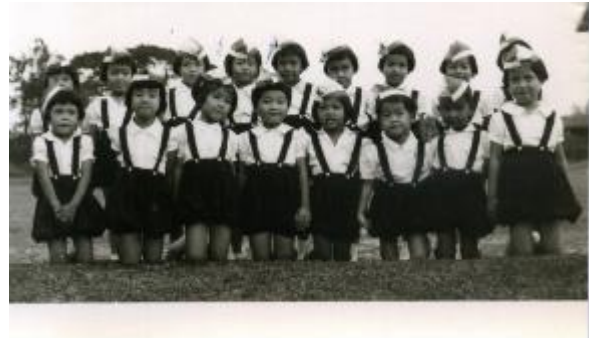
10. AGUUR, Collection Souvenirs des missions, Regina Mundi, Bangkok 1957

Les sœurs poursuivent encore aujourd'hui leur apostolat à travers les Instituts :