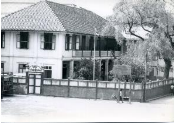
2. AGUUR, Rn.THA.03/1.1, École du Rosaire ou École du Calvaire, [1954]