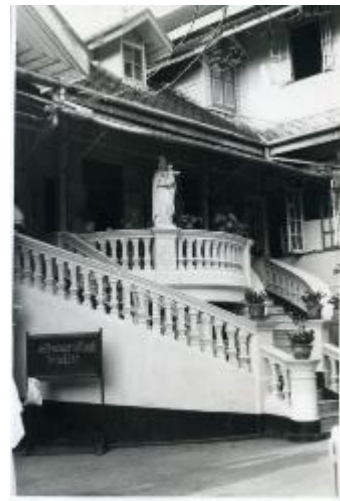
5. AGUUR, Collection Souvenirs des missions, Mater Dei chapelle, Bangkok, [1928-30]

Un grand terrain avait été acheté dans un quartier isolé de la ville ; les sœurs avaient choisi la date du 2 février, fête de la lumière, pour ouvrir cette nouvelle école catholique dans un quartier où le catholicisme n'était pas encore arrivé. Le matin du 2 février, dix Ursulines, conduites par la Révérende Mère Marie-Bernard Mancel , se réunissent dans la pièce qui sera désormais la chapelle, allument la lampe du sanctuaire et célèbrent la première messe. Les écoles des Ursulines offraient des classes dotées d'un équipement moderne et le laboratoire aidait à l'enseignement de l'histoire, de la géographie et des sciences. L'étude des langues est considérée comme très importante. Quant au Calvaire , dix religieuses y restèrent pour continuer l'œuvre, quelque peu modifiée : il y avait Mère Marie Gabriel van Nieuwkuyk et Mère Marie Agnès de l'Eucharistie Delattre . Peu à peu, l'école s'adapte aux nouveaux programmes officiels des écoles de filles .