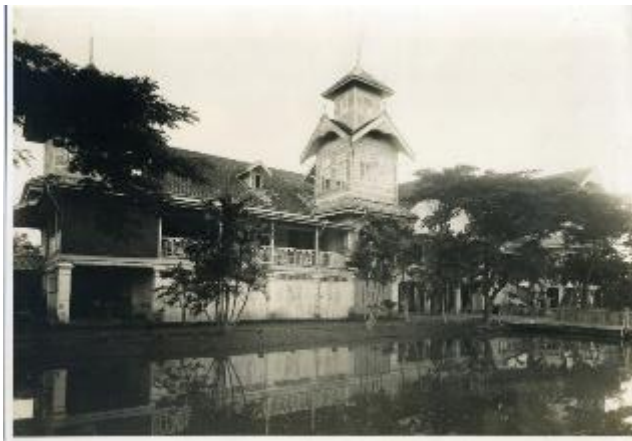
4. AGUUR, Rn.THA.04/1.1, Mater Dei, Bangkok, 1928

À la demande de l'évêque René Perros , les Ursulines ouvrent une autre école à Bangkok en 1928 pour les Siamois des classes supérieures : « Mater Dei Institute » (fig. 4-5).