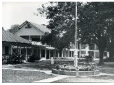
7. AGUUR, Rn. THA.06/1.1 , Regina Coeli, Chiangmai, Vue d'une partie du bâtiment, 1950