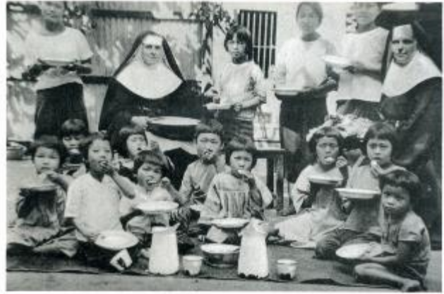
3. AGUUR, Rn.THA.03/2.10, Orphelinat de la paroisse du Calvaire, 1925

À la demande de l'évêque René Perros , les Ursulines ouvrent une autre école à Bangkok en 1928 pour les Siamois des classes supérieures : « Mater Dei Institute » (fig. 4-5).