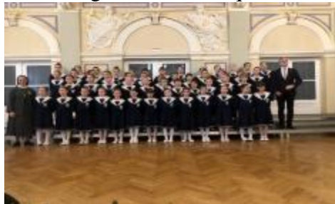
La chorale : « Les astres de Ste Ursule »

Le dévouement et la détermination avec laquelle nos sœurs dirigent nos deux écoles de Sainte Ursule place nos écoles parmi les meilleurs de la ville, voir du pays. En visitant les classes j'ai remarqué une bonne atmosphère entre enseignant-enfants qui est très importante dans l'éducation