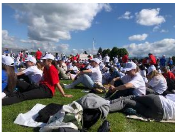
Rencontre Nationale des Jeunes à Gospić