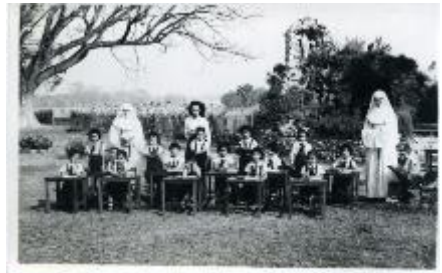
8. Chiang Mai classe, [1935-36]

En 1955, une demande d'ouverture d'une troisième maison de mission à Bangkok a été formulée. La réponse à la demande est positive et l'autorisation est accordée le 9 mai 1955 . 3 L'école créée à partir de cette mission s'appelle Vasudevi ou Regina Mundi (fig. 9-10). A l'origine, l'école ne pouvait accueillir que 17 pensionnaires, mais la forte demande a permis de rénover et d'agrandir le bâtiment en 1958. Depuis, l'Institut a accueilli un grand nombre d'étudiants et reste aujourd'hui une référence en matière d'éducation dans la capitale.