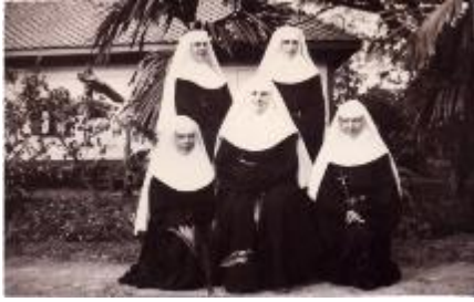
6. AGUUR, Rn. THA.06/2.04 , Fondatrices de la deuxième école et communauté des Ursulines, Regina Coeli, à Chiangmai, 7 avril 1932

d'activités éducatives appartenant à l'apostolat missionnaire soient inaugurées dans cette zone de la mission. C'est pourquoi, en plus des écoles pour les classes supérieures et moyennes, elles ont organisé des cours gratuits dans les écoles pour les enfants des classes pauvres.