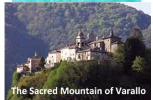
The Sacred Mountain of Varallo

pèlerinage à Varallo, un sanctuaire dans les montagnes des Dolomites, qu'Angèle, durant de longues heures de prière, a compris de façon claire l'appel de Dieu.