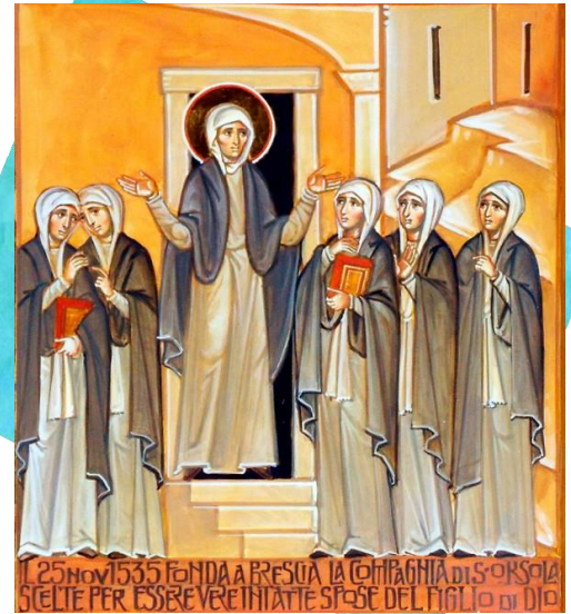
(Paolo Orlando, 2007)

Nos Associées/Compagnes Ursulines trouvent leur vie spirituelle renforcée de diverses manières. Beaucoup ont partagé comment une connaissance plus approfondie de Sainte Angèle - sa vie, ses paroles, ses expériences, sa foi, son accompagnement - renforce leur vie, ravive leur propre spiritualité, et les enracine dans les valeurs et les vertus qu'elle a vécues. Les valeurs et vertus les plus fréquemment mentionnées sont la bonté, la compassion, l'espérance, la gratitude, la sagesse et la dépendance à l'égard de Dieu. Il est tout aussi important et vital de renforcer sa vie spirituelle en faisant partie d'une communauté de soutien et d'entraide avec laquelle on peut se réunir, prier, partager et rompre le pain. Les Associés et les Compagnons ont réfléchi à la joie, à l'espérance et à la camaraderie qui sont favorisés par le fait de se réunir et d'être ensemble. Les idées partagées sur Angèle, ainsi que la volonté de chacun de partager les hauts et les bas de son propre cheminement spirituel, sont une source de force pour le parcours de foi que chacun entreprend jour après jour.