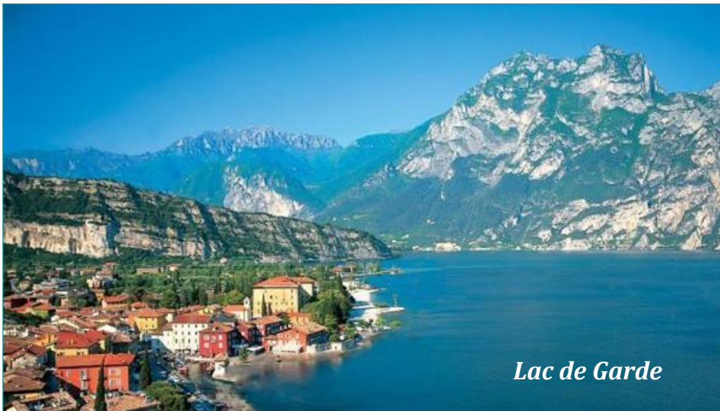
Lac de Garde

Comment répondez-vous personnellement aux questions posées aux Associés/Compagnons d'Angèle ?